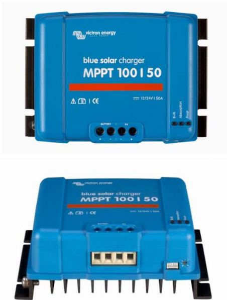
Solar Lade-Regler MPPT 100/50