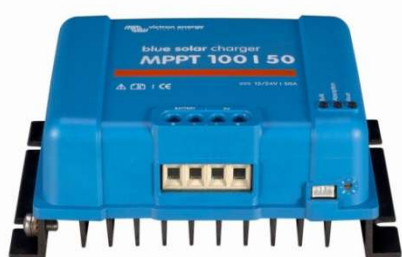
Solar Lade-Regler MPPT 100/50